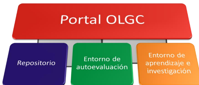
Gráfico 3. Entornos virtuales del OLCG

Como se puede observar, el repositorio se plantea como un entorno virtual interconectado a otras plataformas, conformando así un sistema integrado de gestión de la información y el conocimiento especializado en gestión cultural. 14 Así, el objetivo del repositorio es reunir, organizar y socializar recursos informativos relacionados con el campo de la gestión cultural con el propósito de fortalecer los procesos de formación, investigación y práctica de los gestores culturales en Latinoamérica.